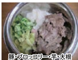
豚・ブロッコリー・芋・大根