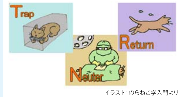
イラスト:のらねこ学入門より

私達のもとにはたくさんの苦情も寄せられますが、「最近野良猫が随分減ってきましたね」という声が数多く届くようになってきました。芦屋市内から、兵庫県動物愛護センターへ持ち込まれ殺処分となっている猫の頭数も、年々減少傾向にあるようです。これ以上不幸な命を増やさないためにも、私達のTNR活動が役立っていることを信じて、今後も頑張りたいと思っています。