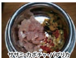
ササミ・カボチャ・パプリカ

【注意】分量は今まで与えていたフードの見ためと同じ量(重さではない)を与えて下さい。持病やアレルギーのあるワンちゃんは、獣医さんの指導を仰いでください。下記のものとは与えないように注意してください。