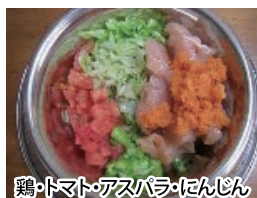
鶏・トマト・アスパラ・おせんじ