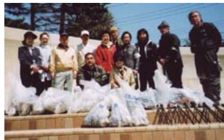
下流チーム 任務完了で「はい、チーズ!」