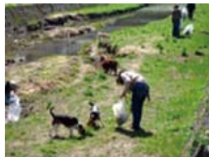
ワンちゃん連れの参加が何組もあって楽しかったね!

犬の放置糞、ポイ捨てされたタバコの吸殻、空き缶その他色々なゴミでいっぱいになった袋の山を見て、改めてマナー啓発運動の必要性を感じました。この日収集されたゴミの量は、上流220kg、下流80kgの計300kgでした。