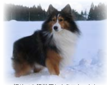
初めての銀世界にもうワクワク♪

『こんにちは！僕シェルティーのびーちゃんです。5歳の男の子だよ。もうなんたって元気一杯!! 僕は散歩が大好き。毎日の散歩も楽しみだけど車に乗って行く散歩は格別なんだ。その中でもたまにしか行けないけどお泊りの散歩は最高。お姉さんたちは「旅行」って呼んでるけどね。みんなも一度行ったら好きになると思うんだ。さあ、ワンコの旅行に行出発進行〜♪』