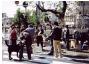
上流チーム 只今作戦会議中!

参加者全員がそれぞれに配られた軍手とビニール袋と火バサミを持って、協会名入りの腕章をつけた会員とともに、兩岸の河川敷、芦屋川の中、川沿いの歩道や車道などに落ちているゴミを拾って汗を流しました。